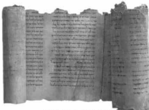
FINTE SCRITTA ROTOLO DEL MAR MORTO

La storia si basa su una conoscenza per tracce, in quanto lo storico studia fatti che non ha direttamente vissuto. Queste tracce sono le fonti o documenti, termini con cui si indica ciò che gli storici utilizzano per poter ricavare informazioni sul passato.