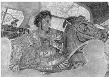
Un grande uomo che ha fatto storia