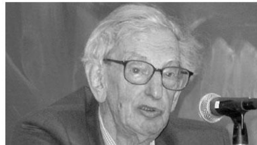
Un storico contemporaneo che è un grande interprete della storia

Il primo fattore della storia, quindi, è l'uomo, perché egli la produce, la narra, la interpreta.