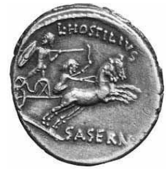
MONETA ROMANA (Numismatica)

Di rilevante importanza sono inoltre i contributi dell' antropologia , la disciplina che si occupa degli aspetti biologici e comportamentali della razza umana, della sociologia , con i suoi studi sui comportamenti sociali, della demografia storica , della statistica , dell' economia e della geografia .