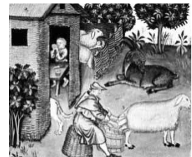
Vita umile nel Medioevo

Di quali uomini si occupa la storia? In passato trattava solo “le gesta dei re”, dando cioè spazio esclusivamente alle vicende dei grandi eventi, solitamente di natura politica e militare, e mettendo al centro di ogni interesse le grandi personalità, quali: re, papi, condottieri e imperatori. La ricerca storica contemporanea si muove invece in un campo più vasto e complesso: quello che ha come attori anche gli uomini comuni e si propone di ricostruire i cambiamenti della società in una dimensione più ampia, occupandosi, per esempio, degli aspetti economici, sociali, culturali e della vita quotidiana del passato.