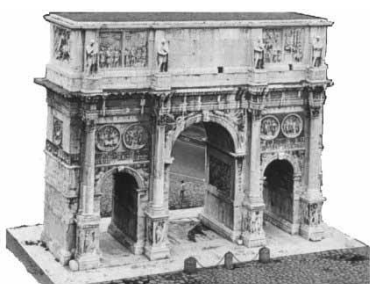
ARCO DI COSTANTINO

Fra le fonti scritte si annoverano i documenti ufficiali (atti pubblici e privati, trattati, leggi, bilanci, verbali ecc.) e le fonti narrative (cronache, opere letterarie, diari, lettere private, opere storiche, biografie ecc.). Non meno fondamentale è la classificazione delle fonti in primarie o dirette e secondarie o indirette . Le prime mettono lo storico a contatto con un frammento del passato senza una mediazione, perché appartengono al periodo studiato e riguardano specificamente l'oggetto trattato, Tali sono i resti archeologici, ma anche molte fonti scritte archivistiche (un atto notarile, un diploma imperiale, una mappa catastale ecc.) Sono primarie anche le fonti orali, che ci restituiscono la testimonianza di chi ha partecipato ad un evento. Le fonti indirette, invece, mettono a conoscenza di un avvenimento tramite un mediatore (un cronista, un pittore, un letterato.). A questa categoria appartengono le opere storiografiche scritte in passato ed anche le opere letterarie che contengono informazioni storiche.